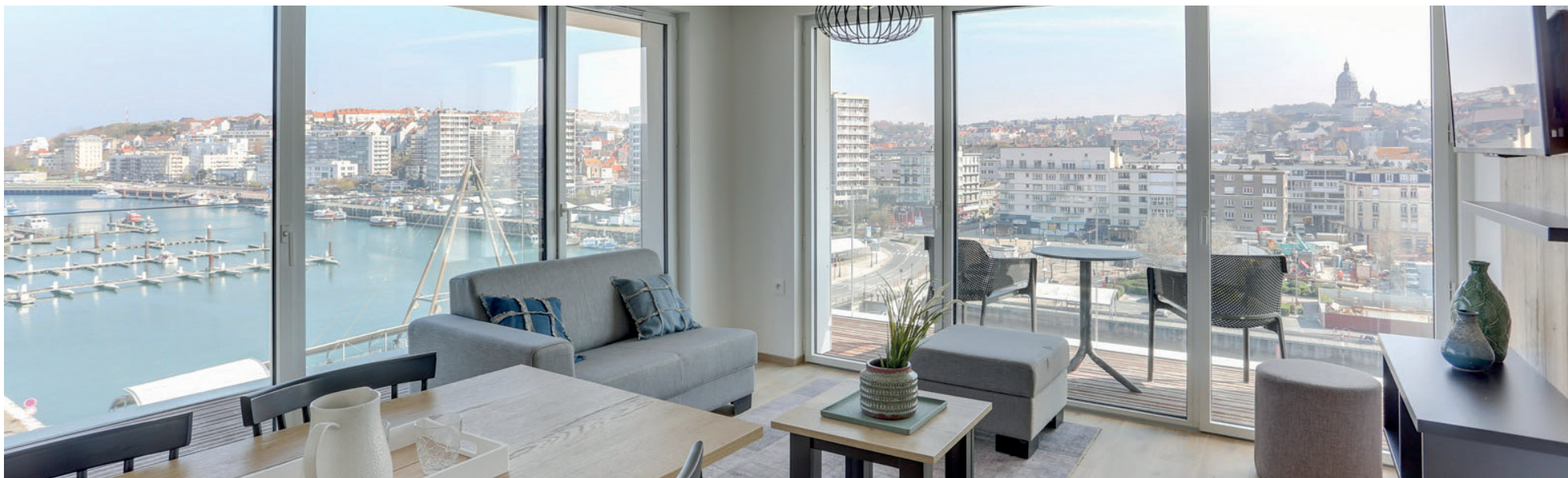
La Marina Boulogne-sur-Mer