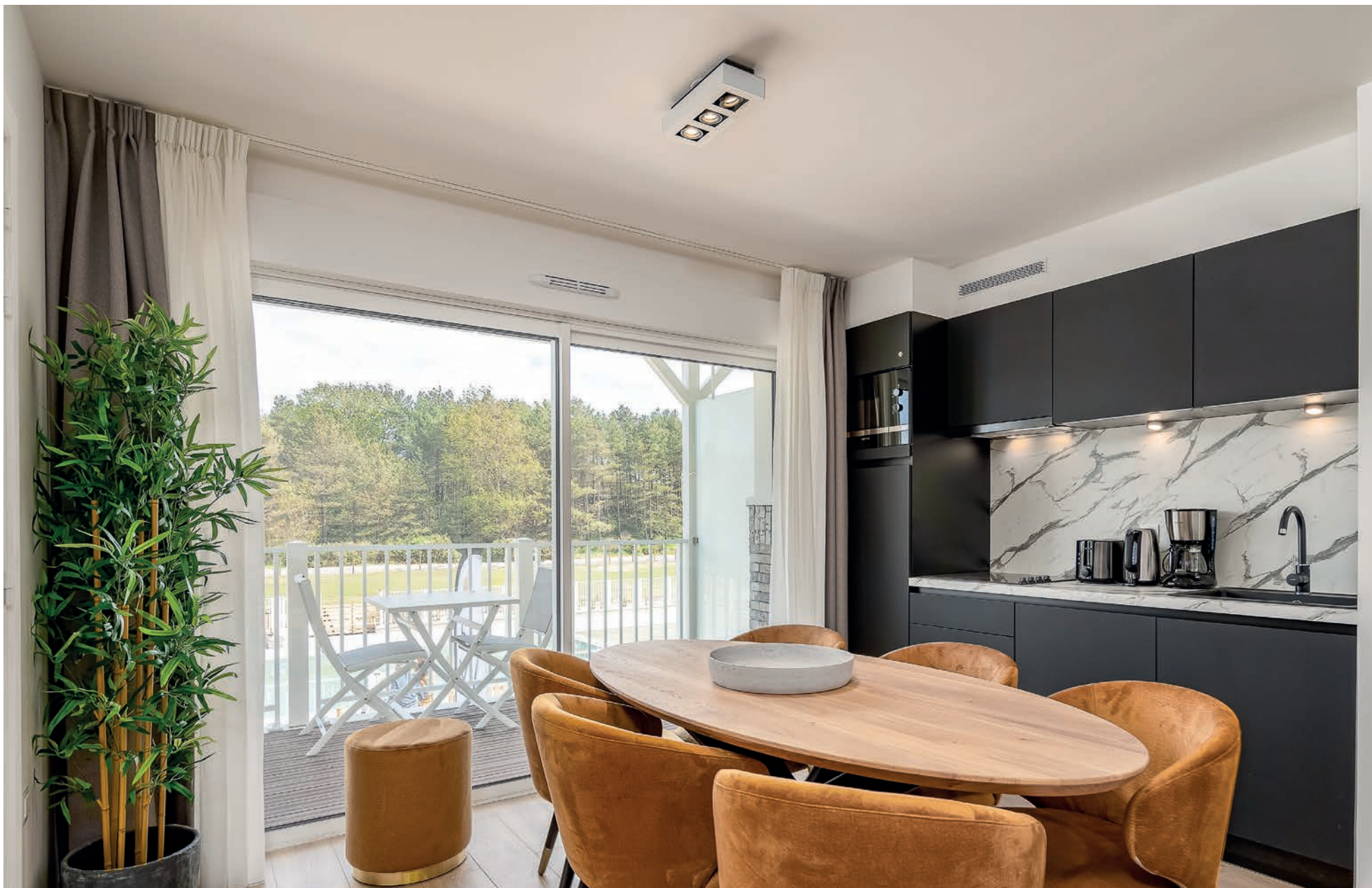
Trésors d'Opale Camiers Sainte-Cécile