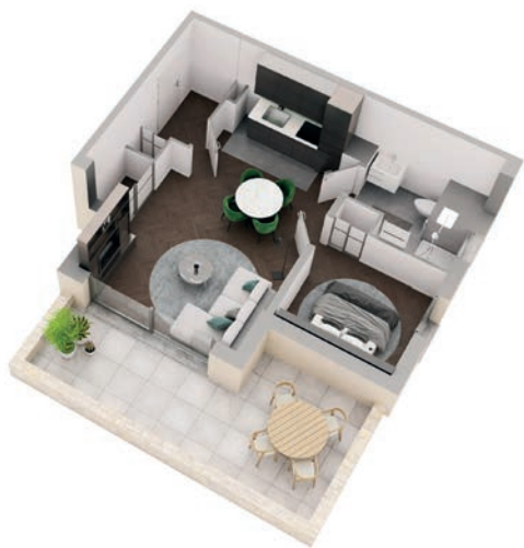
Eén slaapkamer Vanaf 40 m 2