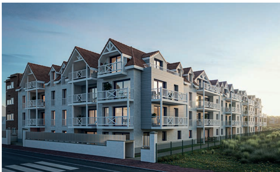
Rêve des Sables Bray-Dunes