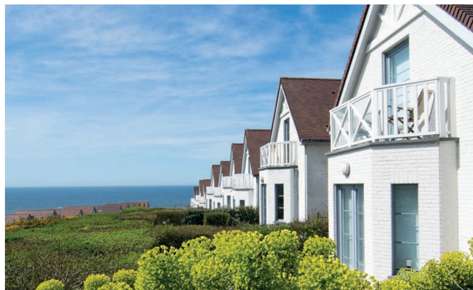
Le Domaine Sauvage Equihen-Plage