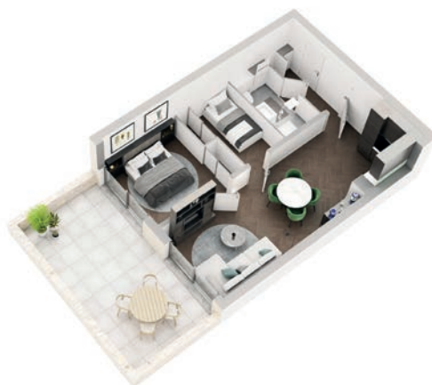
Eén slaapkamer en een bijkomende ruimteA Vanaf 51 m 2