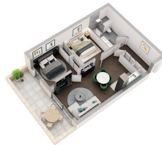
Twee Slaapkamers Vanaf 54 m 2

Chaque appartement dispose d'une terrasse ou d'un balcon. Cave et parking disponibles.