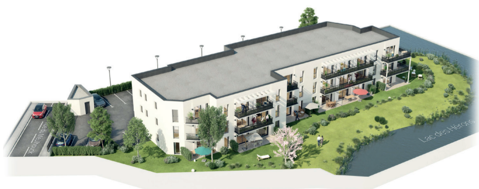
Studio, T2, T2 Cabine, Garage en Parking